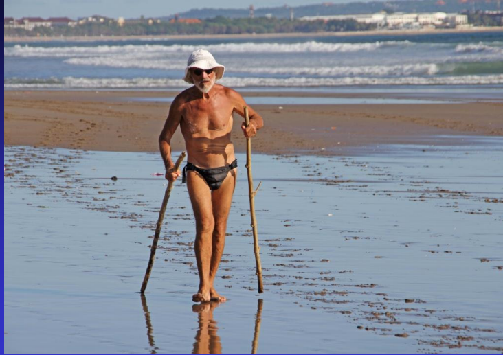
Bali - Legian Beach - 2012