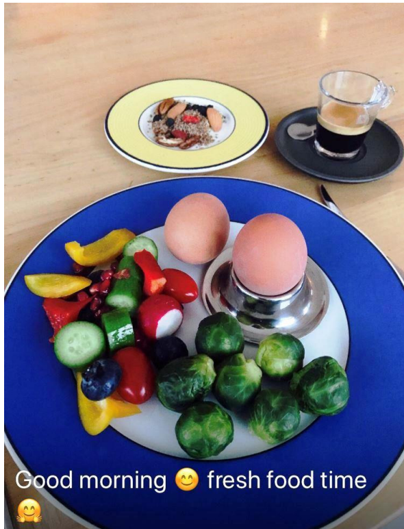
Kreation und Bild: Samira Eichhorn Signer - Februar 2018